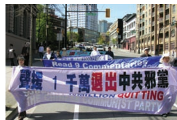
温哥华声援一千万退党