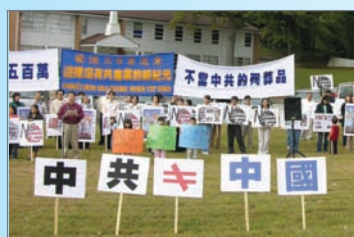
美国亚特兰大举办退党集会

自从2004年11月，大纪元时报发表《九评共产党系列社论》，从历史、政治、经济、文化、信仰等层面深刻皆是中共的欺骗、暴力、邪教和流氓本性。《九评》在大陆引发空前退党大潮，至今，已经发