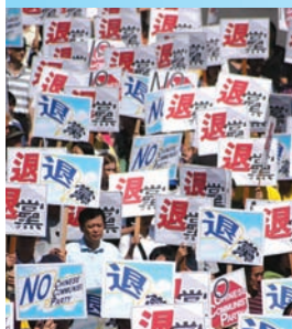
芝加哥1000万退党大游行

在海外，全世界都关注这群2500万的退党勇士，他们在各个国家、地区举办了800多场