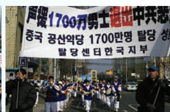
韩国声援1700万退党大游行