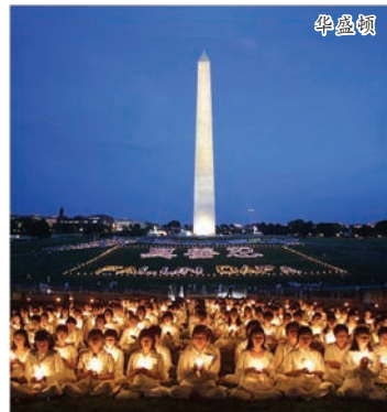
法轮功学员以烛光悼念被害致死的同修