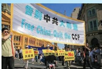
澳洲墨尔本声援900万人退党游行