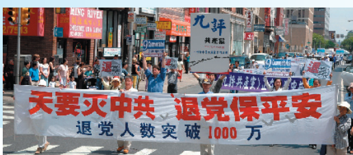
支持一千万华人退出中共费城华埠大游行