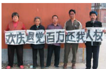
中国大陆民众欢庆百万人退党