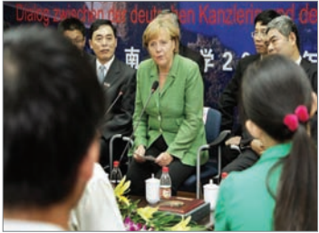
2007年8月28日，德国总理默克尔在南京大学演讲时，特别强调中国尊重人权的重要性。

继2006年5月首度访问中国后，德国总理默克尔今年8月在中国领导人面前再度直言中国的人权和侵权等敏感问题。