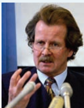
联合国酷刑专员曼弗雷德·诺瓦克 (Manfred Nowak)

在最新公布的2007年联合国报告中，纪录去年联合国人权委员会酷刑问题特别报告员—曼弗雷德·诺瓦克 (Manfred Nowak) 针对中共活摘法轮功学员器官的指控所做的调查。