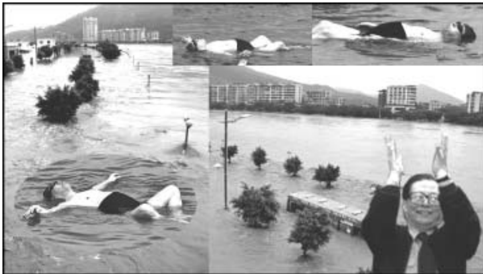
9. 江泽民的确长相酷似蛤蟆且嗜水出名，出访常去水中泡泡，住的酒店多养有水生尤物。他在夏威夷和死海游泳的照片，五指张开的爪式鼓掌方式乃江的独家特色。