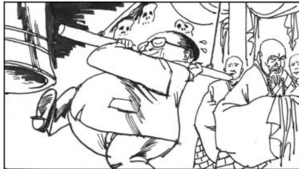
6. 96 年，江泽民去南方路过一著名寺院。在大殿上香后不听方丈相劝，执意撞钟，老方丈垂泪，说江本蟾王（大蛤蟆）转世，钟声一响，必定引发中原水族作怪，从此中原大水连年，再难平安。