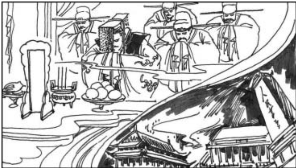
1. 中共鼓吹“无神论”，中共的斗争哲学违背了中国传统文化最精髓的敬神明与天地自然、天人合一的理念，破坏了中国的自然环境，白洋淀等湖水干涸、北京等古城格局被破坏、古迹被毁。