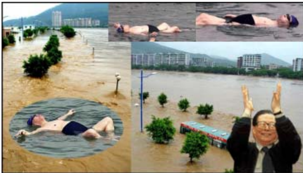
9. 江泽民的确长相酷似蛤蟆且嗜水出名，出访常去水中泡泡，住的酒店多养有水生尤物。他在夏威夷和死海游泳的照片，五指张开的爪式鼓掌方式乃江的独家特色。