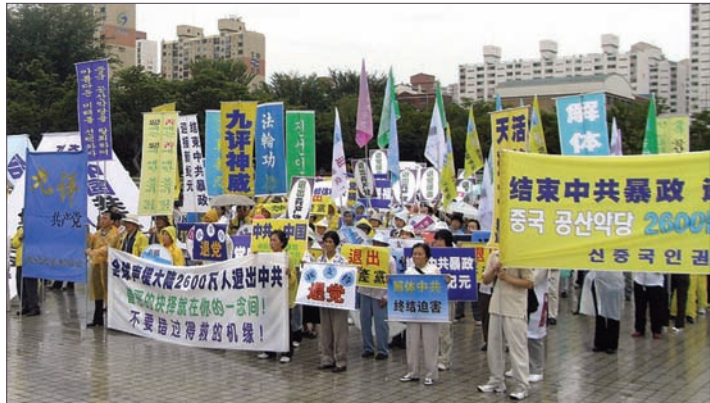
9/16韩国安阳举办声援二千六百万退党集会游行

这次评奖，人权委员会一致通过颁发给蒋彦永和高耀洁，因为两人都是顶着压力揭露疫情真相的医生。蒋彦永在本台