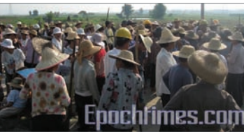
2007年9月14日，广东潮州再次爆发大规模村民维权护地活动。

广东省潮州饶平县所城镇龙湾村因土地徵收问题及村官贪污问题，村民长期上访维权未果，却遭到镇政府的暴力镇压，多次发生流血事件。逼于无奈，村民从2006年在华丰造气厂附近搭棚堵路维权至今。