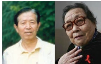
蒋彦永(左)及高耀洁(右)

美国纽约科学院将2007年度科学家人权奖颁赠给揭露中国SARS和艾滋病疫情的蒋彦永及高耀洁医生。9月20日在其年度会议上颁奖。高耀洁医生的