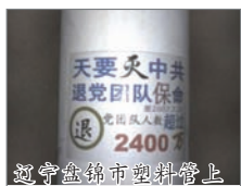
寧波鄞縣市塑料管上