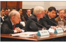
美国会举办活摘器官听证会

2006年9月29日，美国国会就中共摘取法轮功学员器官指控举办听证会。议员罗拉巴克表示，“面对世界上发生的这场邪恶，我们不会闭上眼睛。我们不能仅仅因为与那个专制政权的商业交易中获得利益，就无视这场邪恶。”