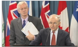
加拿大前亚太司司长大卫·乔高(左)和国际人权律师大卫·麦塔斯

前加拿大亚太司司长、国会议员大卫·乔高和国际人权律师大卫·麦塔斯，共组独立调查团。他们以分析33个不同方面的证据证实中共活体摘取法轮功学员器官，而且现在仍在持续着。报告指出贩卖器官已成为医院(包括军队医院)重要资金来源，众多证据中最直接的是电话录音，医院人员在电话访谈中承认器官来源有法轮功学员。