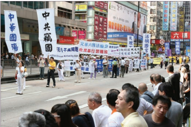
香港举行声援2700万退党游行

大纪元社论《九评共产党》发表以来，至今在大纪元退党网站上三退数字已突破二千七百万。9月30日，在中共窃国日也是中华国殇日的前夕，香港退党服务中心联合香港大纪元等团体机构举行声援二千七百万勇士退出中国共产党及其相关组织的集会游行。