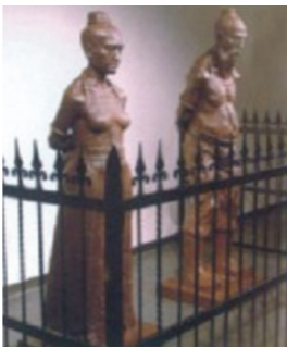
上海艺术馆2005年10月22日展出的作品，名叫《跪了492年，我们想站起来喘口气了》）