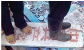
广西博白民众纷纷退出中共

北京军区的一名现役军官“十年兵”表示：如果没有朋友带来真实的资讯和真相的讲解，我或许一辈子都会在专制的制度下为专制党卖一辈子