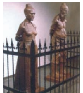
上海艺术馆2005年10月22日展出的作品，名叫《跪了492年，我们想站起来喘口气了》）