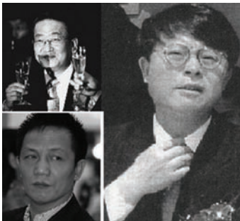
家帮直接挂钩的周正毅案，备受外界关注。