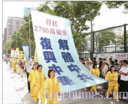
香港声援2700万退党游行

中共十七大刚落幕，海内外舆论普遍认为会议回避重大现实问题，如回避持续镇压八年的法轮功问题及隐瞒正发生的退党潮，十七大是中共各派权利妥协的产物，毫无新意。