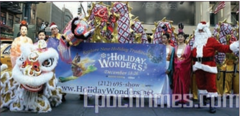
新唐人电视台主办的圣诞晚会，已开始售票。

舞台天幕设计，一流的演出队伍，让观众在追溯古老之神传文化中，见证纯善纯美新文化之复兴，并为之倾倒。