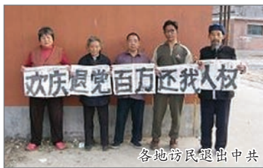
各地访民退出中共