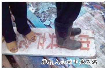
维权人士对中共不满