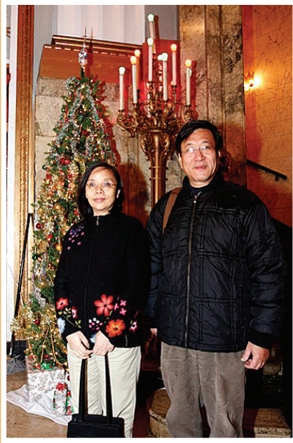
圖：著名社會經濟學家程曉農及夫人何清漣。

著名社會經濟學家程曉農及夫人何清漣觀看了二零零七年十二月十九日的新唐人聖誕晚會。程曉農說：「無論從藝術表演形式上，還是從所要傳達的理念，新唐人晚會開闢了一個新的時代，向華人和西方觀眾充份展現了完全沒有黨文化痕跡的中華文化的狀態。而這正是人們目前所需要的。」