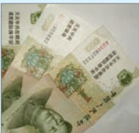
纸币上印有退党讯息