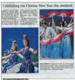
德拉华郡新闻报 (News of Delaware County) 1月2日报导“这个周末庆祝中国新年”

神韵表演订票及相关讯息请上网查询： http://zh-hans.bestchineseshows.com