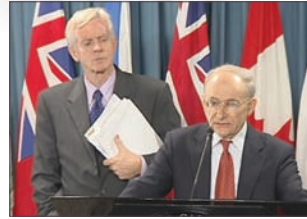
调查员大卫·乔高(左)大卫·麦塔斯

加拿大前亚太司司长大卫·乔高和人权律师大卫·麦塔斯组成独立调查团，他们以32种论证方法证实中共活体摘取法轮功学员器官牟利的罪行。