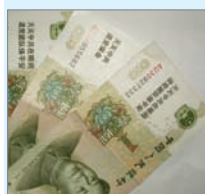
纸币上印有退党讯息