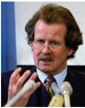
联合国酷刑专员曼弗雷德·诺瓦克 (Manfred Nowak)

在最新公布的2007年联合国人权委员会酷刑问题特别报告员—曼弗雷德·诺瓦克 (Manfred Nowak) 针对中共活摘法轮功学员器官的指控所做的调查。调查报告指出，中国大陆众多