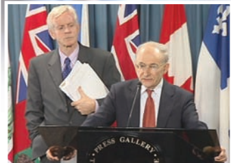
调查员大卫·乔高(左)大卫·麦塔斯

加拿大前亚太司司长大卫·乔高和国际人权律师大卫·麦塔斯共同组成第三方独立调查团，他们以32种论证方法证实中共活体摘取法轮功学员器官牟利的罪行。