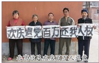
北京访民庆祝百万人退党