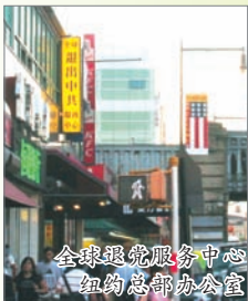
全球退党服务中心 纽约总部办公室