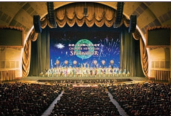
神韵晚会展现中国纯正文化，广受全球观众好评

神韵表演订票及相关讯息请上网查询： http://zh-hans.beschtineseshows.com