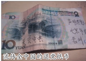
流传全中国的退党纸币