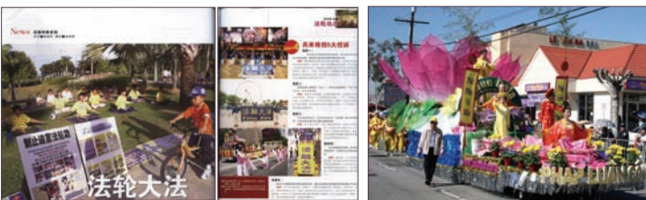
马来西亚《风采》杂志专题报导法轮功