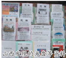
山西发现的光盘等资料