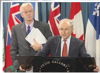
调查员大卫·乔高(左)大卫·麦塔斯

加拿大前亚太司司长大卫·乔高和国际人权律师大卫·麦塔斯共同组成第三方独立调查团，他们以32种论证方法证实中共活体摘取法轮功学员器官牟利的罪行。