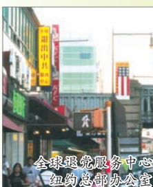
全球退党服务中心 纽约总部办公室