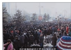
蚂蚁养殖户聚集抗议

目前辽宁当局仍对“蚁力神”数百万陷入生存绝境的蚁民无任何表示，养户已逐渐识破政府抢了他们钱，还要把他们逼向死路的企图。一位蚁民说，“我是党员我想退党，党费已不交了！我对共产党失去信心了，我都快退休的人了，怕啥呀？”