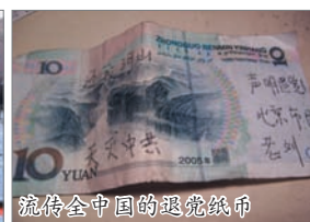
流传全中国的退党纸币