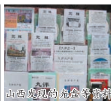
山西发现的光盘等资料