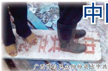
广西博白民众纷纷退出中共

2004年11月，大纪元发表系列社论《九评共产党》，至今年有年，引发超过三千二百万人的三退（退党、团、队）大潮，中共政权即将崩溃。