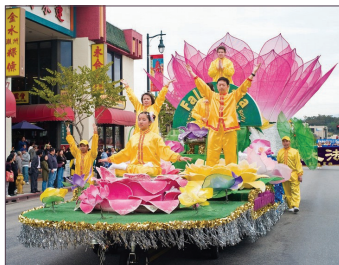
2月23日，千名法轮功学员在洛杉矶市举行游行，要求停止迫害。