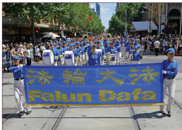
1月26日天国乐团参加澳洲墨尔本的国庆节游行，气势恢宏。

中共镇压法轮功已八年，不放弃信仰的法轮功学员被打死打残，至今核实被迫害致死人数已达3139人。但修炼者坚忍不拔的意志及真、善、忍的理念为世人所支持，法轮大法已广传近八十多个国家和地区，相关书籍译成30多种语文，各国褒奖达1501项。