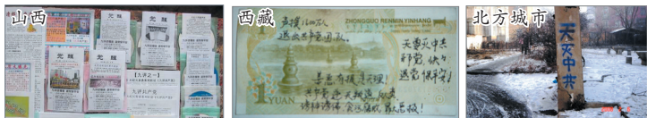
“九评”光盘传单等资料 纸币写上退党声明等讯息 张贴九评三退警语

在中国大陆，媒体封锁非常严重，不让老百姓知道三退大潮，正义人士将《九评》、三退讯息公布在各大公共场所，这些资讯震撼了世人，中共掩盖三退大潮、粉饰太平的谎言不攻自破！