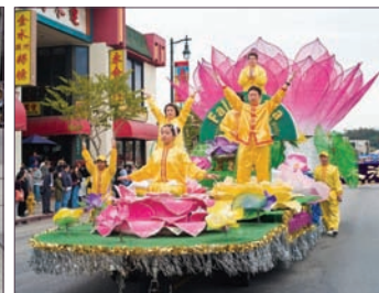
2月23日，千名法轮功学员在洛杉矶市举行游行，要求停止迫害。