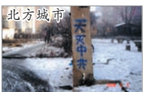
“九评”光盘传单等资料 纸币写上退党声明等讯息 张贴九评三退警语