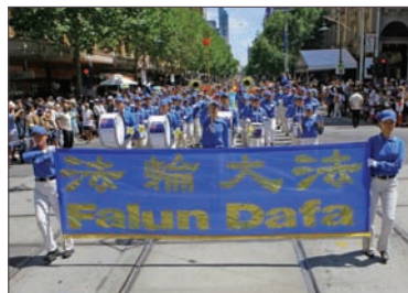
1月26日天国乐团参加澳洲墨尔本的国庆节游行，气势恢宏。

中共镇压法轮功已八年，不放弃信仰的法轮功学员被打死打残，至今核实被迫害致死人数已达3139人。但修炼者坚忍不拔的意志及真、善、忍的理念为世人所支持，法轮大法已广传近八十多个国家和地区，相关书籍译成30多种语文，各国褒奖达1501项。