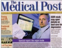
加拿大《医疗邮报》发表中共活摘器官特别报导

加拿大医疗行业最具影响力杂志《医疗邮报》2008年3月11日发表中共活摘人体器官特别报导。报导称，杰瑞·卡夫曼医生认为（中共）活摘器官的行径还在继续发生着，他称其为又一个大屠杀。卡夫曼说，“面对这样的残暴，良心让我不能保持沉默。”