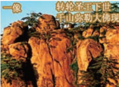
一像 转轮圣王下世 千山弥勒大佛现