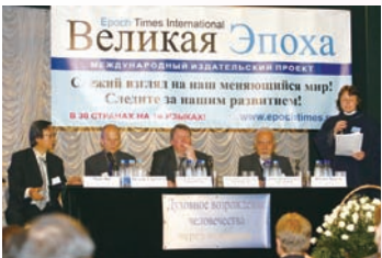
九评研讨会-俄罗斯