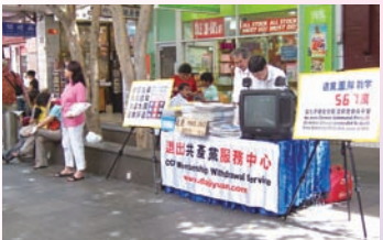
退党服务中心-澳洲