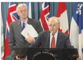
大卫·喬高(左)和大衛·麥塔斯

2006年7月6日，加拿大著名人权律师大卫·麦塔斯和前亚太司司长大卫·乔高公布他们的独立调查报告，证实中共大规模活体摘取法轮功学员器官牟利的罪行，并指出：“中国政府及其各地的机构，尤其是医院、拘禁场所和‘人民’法院，自1999年以来，已把大量但具体数字不详的法轮功学员处死。他们的重要器官，包括心脏、肾脏、肝脏和眼角膜等，几乎同时被强行摘取后高价出售，这些罪行至今仍在持续。”调查者称这是“这个星球上前所未有的罪恶！”（调查报告下载网站： http://organharvestinvestigation.net ）