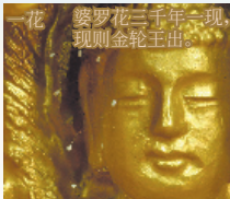
一花 婆罗花三千年一现 现则金轮王出