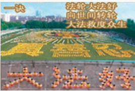
一诀 法轮大法好 向世间转轮 大法救度众生

续在中国、澳洲、美国等世界各地绽放。按佛经记载：三千年开花的婆罗花意味着转轮圣王已下世在人间正法，2007年按佛记是3034年，遍观中原上下，只有法轮佛法于世间鼎力转轮，然而中共自1999年7月下令镇压法轮功，由佛花遍开而揭示中共因对抗天法必遭天谴的宿命。