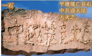
一石 平塘现亡共石 中共谤天法 天火之