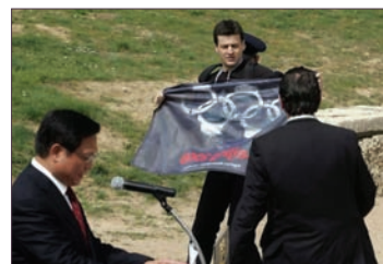
希腊取火仪式上遭人权组织抗议

希腊时间3月24日中午，奥林匹亚山顶2008年奥林匹克运动会的火把取火仪式正式开始时，现场出现五个黑色手铐组成的五环旗帜。面对国际人权组织的抗议，许多人才明白这位点火仪式负责人、北京奥运会组委会主席刘淇，是被美国法庭宣判犯有反人类罪和酷刑罪的罪犯。外界评论说，这不但是奥运史上的最大污点，也是当今人类最大的耻辱。