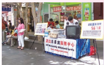
退党服务中心-澳洲