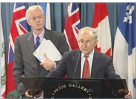
大卫·喬高(左)和大衛·麥塔斯

2006年7月6日，加拿大著名人权律师大卫·麦塔斯和前亚太司司长大卫·乔高公布他们的独立调查报告，证实中共大规模活体摘取法轮功学员器官牟利的罪行，并指出：“中国政府及其各地的机构，尤其是医院、拘禁场所和‘人民’法院，自1999年以来，已把大量但具体数字不详的法轮功学员处死。他们的重要器官，包括心脏、肾脏、肝脏和眼角膜等，几乎同时被强行摘取后高价出售，这些罪行至今仍在持续。”调查者称这是“这个星球上前所未有的罪恶！”(调查报告下载网站： http://organharvestinvestigation.net )