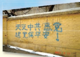
东北街道三退标语

由于中共政权靠谎言暴力维持，花大钱建造网路监控系统、控制所有传播媒体。然而人们仍可透过突破网路封锁等途径，得知外面世界的讯息，拆穿中共的谎言。