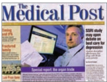
加拿大《医疗邮报》发表中共活摘器官特别报导

加拿大医疗行业最具影响力杂志《医疗邮报》2008年3月11日发表中共活摘人体器官特别报导。报导称，杰瑞·卡夫曼医生认为(中共)活摘器官的行径还在继续发生着，他称其为又一个大屠杀。卡夫曼说，“面对这样的残暴，良心让我不能保持沉默。”