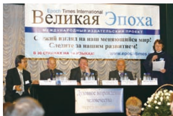
九评研讨会-俄罗斯