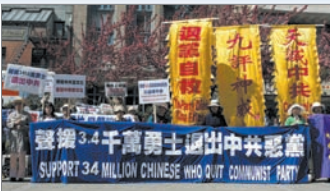
美国旧金山支持退出中共集会