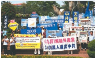
马来西亚声援三退集会