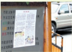
上海街道的九评传单