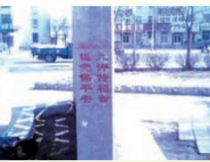
辽宁地区的三退标语