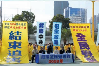
香港支持三退民众大潮游行

自2004年11月底《九评共产党》问世以来，引发空前罕见的三退(退党退团退队)浪潮，目前三退总数已超过3500多万人，受到中国及世界各地民众广泛关注及支持。