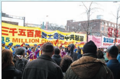
加拿大多伦多声援中国三退勇士集会