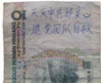
纸币写九评三退标语