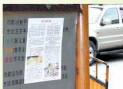
上海街道的九评传单