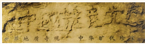
贵州奇石现“中国共产党亡”

著名人权活动家吴弘达指出，历史性转变的时机已经到了，1991年在东欧、苏联发生的事情（共产体制解体）一定会在中国发生。现在有很多人退党，可能有一天会出现一种雪崩似的变化，共产党很可能一