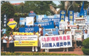
马来西亚声援三退集会