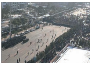
蚁力神养殖户聚集抗议

美东时间2008年4月12日，全球退党服务中心对“蚁力神”受害民众发表一封公开信表示，共产党政府对于“蚁力神”倒闭造成百万养户的惨痛损失，几十位蚁民的自杀命案没有任何道歉和赔罪，而只想以百分之几的返款结案了事。