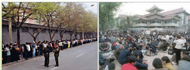
1999年4月25日万名法轮功学员依法去国务院信访办和平上访。

1999年何作庥(罗干的连襟)在天津出版的《青少年科技博览》上发表文章，诬陷一学生因炼法轮功得精神病，文中暗指法轮功会亡党亡国。天津法