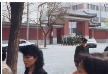
和上访群众隔街相望的是中南海西门（这里可以看到中南海的红色围墙）