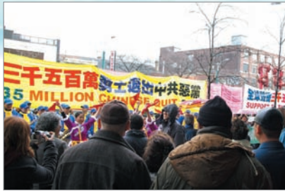
加拿大多伦多声援中国三退勇士集会