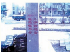
辽宁地区的三退标语