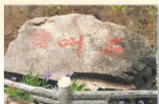
太行大峡谷猪叫石

从1949年以后，中国有一半以上的人口受到过中共的迫害，估计有八千万人非正常死亡，超过人类两次世界大战死亡人数的总和。中共的历史，整个就是一部杀人历史。