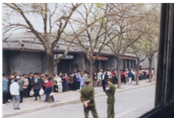
执勤的警察在闲聊（注意群众身后不是中南海特有的红色围墙）