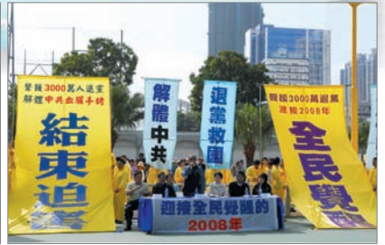
香港支持三退民众大潮游行

自2004年11月底《九评共产党》问世以来，引发空前罕见的三退（退党退团退队）浪潮，目前三退总数已超过3500多万人，受到中国及世界各地民众广泛关注及支持。