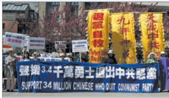
美国旧金山支持退出中共集会