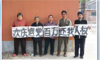
北京访民“欢庆退党百万”

据中国官方统计，大陆民众群体性抗议事件从1993年的8,700起，到2005年8.7万起（即平均每6分钟就发生1起），再到2006年度各种规模的群体性事件近60万起，毫无疑问，中共正坐在民众抗议的火山口上。