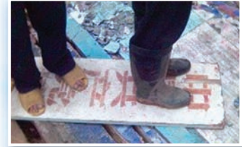
广西博白民众纷纷退出中共

根据大陆商务部统计，港资企业在1978-2006年间以2800亿美元投资中国，期间占中国FDI的比重超过39%。