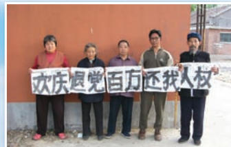
北京访民“欢庆退党百万”

据中国官方统计，大陆民众群体性抗议事件从1993年的8,700起，到2005年8.7万起（即平均每6分钟就发生1起），再到2006年度各种规模的群体性事件近60万起，毫无疑问，中共正坐在民众抗议的火山口上。