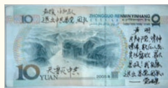
10元纸币上写有退出中共声明

中国大陆许多地方出现退党标语，越来越多人敢于以真名实性退党，正是全民走向精神觉醒的真实体现。这些标语等资料震撼世人，人们议论纷纷，天灭中共为时不远了！