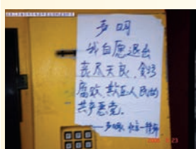
江苏电话亭里张贴三退声明