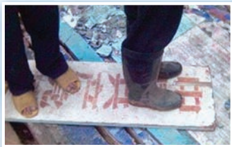
广西博白民众纷纷退出中共