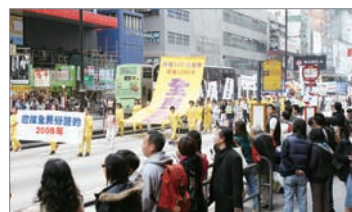
围观香港三退游行的游客

香港退党服务中心义工表示，曾有大陆民众带来一千多个退党声明。“也有一位是大陆地下基督教徒约见了我们，带来了20几人退党的名单。当他看到我们的时候，泪如雨下，诉说被共产党残酷迫害，他说《九评》写得真好啦！老百姓恨透了共产党，他们期待着天灭中共的这一天。”