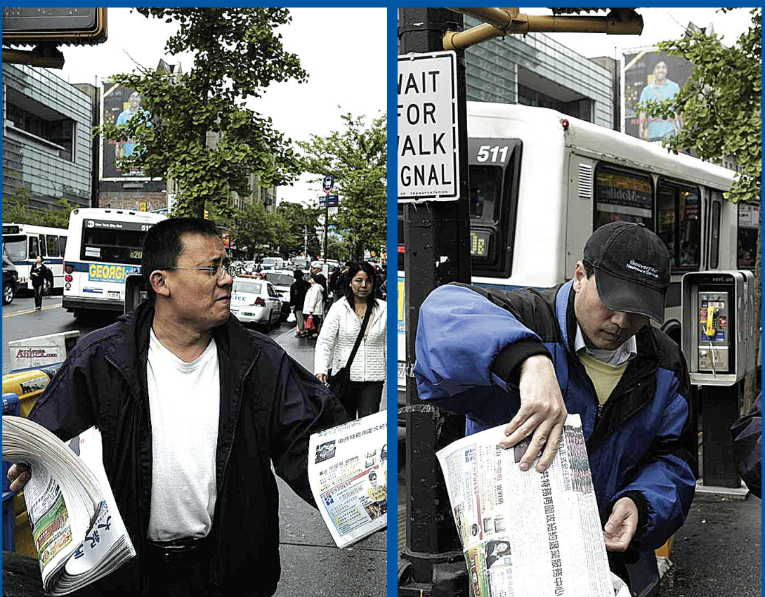
大紀元報導退黨及地震真相，被中共為眼中釘。圖為中共流氓當眾把大紀元發給多人，然後撕毀報紙或丟在地上踩，以此來洩憤。

有路人看到法拉盛這場面，打聽這是幹什麼呢，在街上辛苦維持秩序的老美警察回答：這大概是中國的反共組織和親共組織的對抗。知情人說這是中共買兇攻擊法輪功，而毫不知情的人們則單純地認為：這是一群 Beauty 對陣 Beast。◇