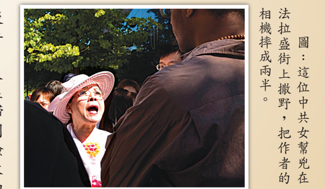
圖：這位中共女幫兇在法拉盛街上撒野，把作者的相機摔成兩半。

他們又馬上把矛頭轉向為我們說話的路人，這個中年婦女摔完我的相機還不算，繼續在那兒用語言侮辱我，我靜靜的舉著摔成兩半的相機一言不發，圍