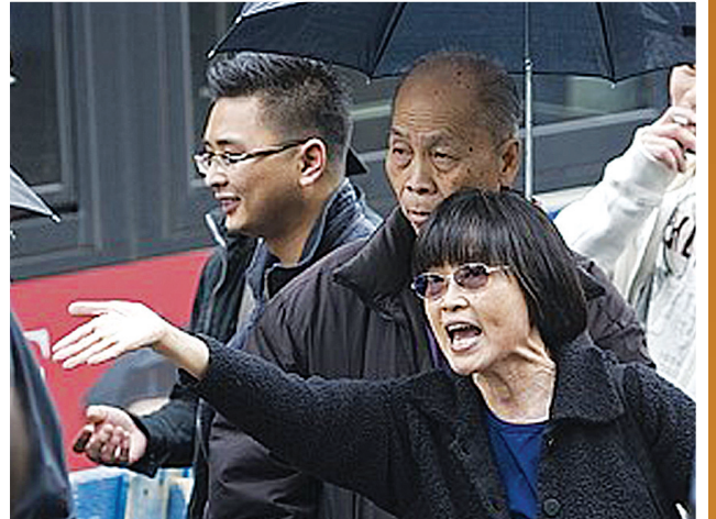
最近兩週以來，一群中共幫兇在紐約法拉盛街頭造謠、辱罵和圍攻法輪功學員，煽動仇恨。他們當中有些人，在眾目睽睽之下，做出下流手勢。圖：法拉盛街頭中共幫兇百態。