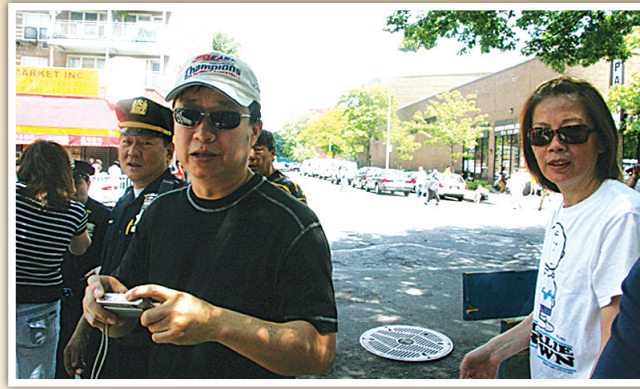
圖：戴墨鏡的男人(左)突然回過頭來舉起相機對我拍照，其他人喊一些不堪入耳的流氓話。從大紀元在網上公布的圖片來看，這些一夥人正是罵法輪功罵得最兇的一幫人。戴墨鏡的男人左邊的女人(背面)已在網上被曝光。(作者提供)