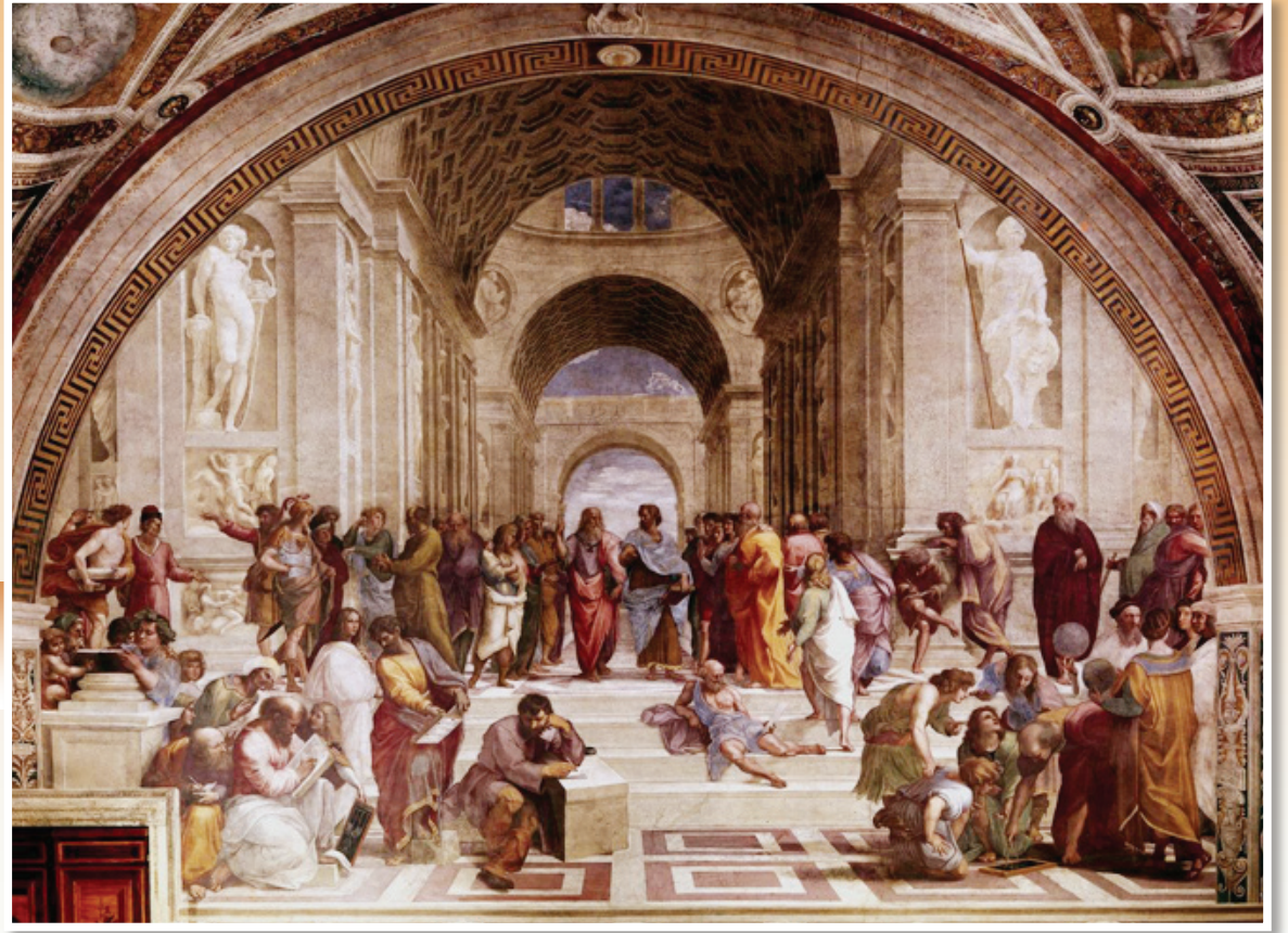
拉斐爾《雅典學院》壁畫。

這些文藝復興時期的寫實成就，為後數百年西方正統繪畫奠定了深厚的基礎，同時樹立寫實繪畫的衡量標準。當然，寫實的成功和媒材的進步是同步進行的，特別是油畫的發明在其中扮演著舉足輕重的角色。◇