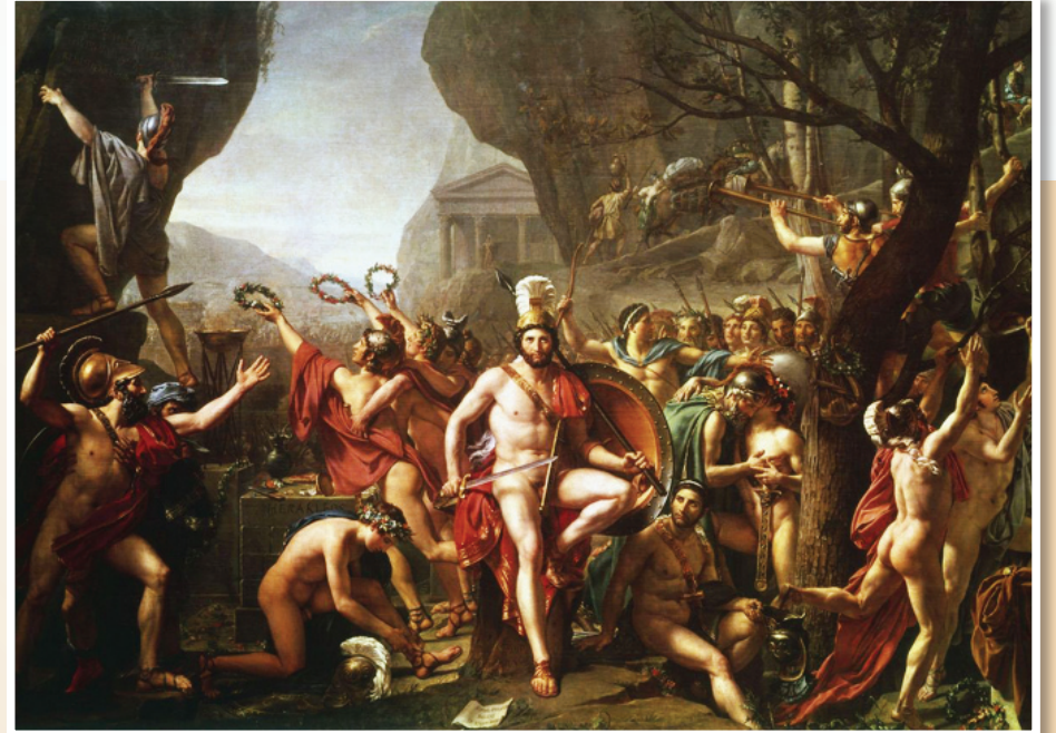
（右圖）雅克·路易·大衛《列奧尼達在溫泉關》

對法國學院理念影響深遠的十七世紀法國畫家普桑曾說：「一幅畫必須包含最高的道德內涵，表現在能傳達其知性內涵的結構中。」因此在學院的教育理念中，藝術創作除了必備的寫實技術外，還必須結合著古典精神，傳遞信仰、道德等正統價值，對社會