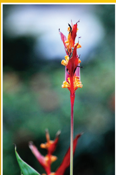
這張鶴望蘭的圖片是以縮短景深來虛化複雜的背景而突出主題。

環境的明暗對比也能產生虛實的感覺，如過度的曝光和局部的曝光不足。都能體現虛實。虛實在構圖的框架裡通常用來襯托某個主題。和繪畫的理論相通，能掌握虛實的關係在突出主題和營造氣氛方面能起到畫龍點睛的效果。◇