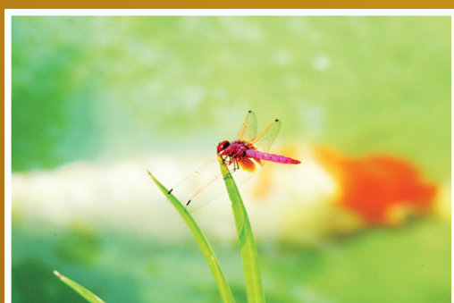
蜻蜓為實，鯉魚為虛的處理，增添畫面的層次和趣味。