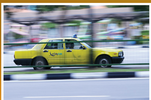
以鏡頭跟蹤主題的動態來達到使背景產生速度感的虛化效果。