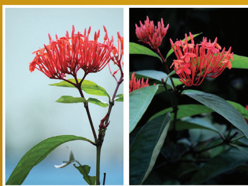
這兩張的圖片以背景光線明暗對比的虛，來襯托花朵實的效果對照。