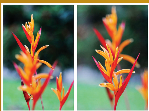
這兩張鶴望蘭的圖片虛實前後對調的效果。