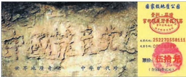
贵州掌布风景区门票印上藏字石

2002年6月在贵州省平塘掌布乡发现石龄为2.7亿年的藏字石，石壁上凸显一排字迹，可清晰地辨识有“中国共产党亡”6个大字，平塘县政府于2003年8月至12月间，连请三批地质专家鉴定“藏字石”为天然形成。