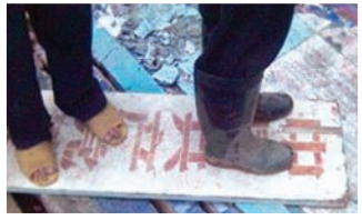
广西博白民众不满中共

2007年至08年8月，湖北宜昌地区优昙婆罗多处绽放。佛经记载：优昙婆罗花为祥瑞之花，三千年开一次，盛开之时，是法轮圣王在人世间传佛法救人之时。