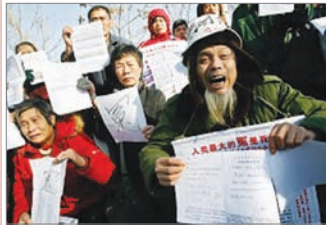
07年12月访民向外国媒体诉冤情

在北京奥运会开幕时，维护新闻自由的国际组织无国界记者在互联网上发起抗议中共政府打压言论自由、要求中共释放被关押的政治犯的活动。到8月15日为止，世界各地上网参加抗议中共政府压制言论自由和要求中共释放政治犯的人数已经超过了17,850人，参加抗议的人数还在不断增加。