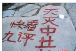
济南大佛头游览区