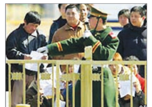
中共严格控制上访民众

以北京上访村为例。海斯说那并不是真正的村庄，而是北京南郊火车站附近的一片破落房屋。几年前海斯就听说那是上千名各地来京上访者暂住地，许多人一住就好几年。奥运开幕前海斯再次走访上访村，但它不见了。