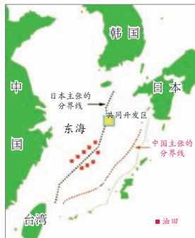
中共将出卖东海油田给日本

东海协议签订后，日本首相福田康夫随即表示将出席北京奥运。东海油田天然气储量是沙特阿拉伯的八倍，其石油储量至少够中国用八十年。