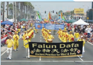
法轮大法广受美国民众欢迎