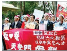
香港支联会前往邮政总局邮寄圣诞卡

香港市民支援爱国民主运动联合会（支联会）12月24日寄出了三千张有着香港市民签字的圣诞卡，慰问六四受难者家属，及被中共关押在监狱中的上千名民主与维权人士。支联会呼吁中共立即所有维权人士。