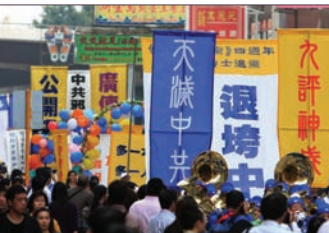
香港声援4500万三退大潮

论坛的研讨会中以录音方式探讨“《九评》现象”和“退党潮”。贾甲表示，《九评》发表后，中国人彻底抛弃对中共的恐惧。过去的群众都在背地里谩骂、揭发，《九评》给了人民力量和鼓舞，中国人民公开谩骂共产党，全国每年几万起民众抗暴运动层出不穷，势不可挡。