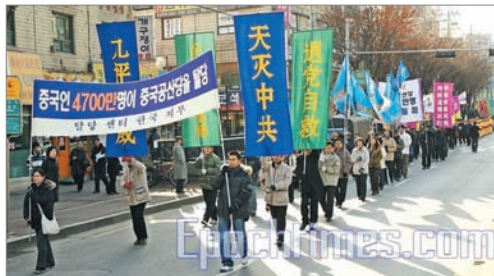
韩国人民声援4700万人退出中共

2004年11月，大纪元时报发表《九评共产党》，对中共进行盖棺论定般的评判。一石激起千层浪，四年以来，《九评》所激起的波浪不但没有止息，反而愈演愈烈。最重要的影响之一，是越来越多中国民众退出中共党、团、队组织。