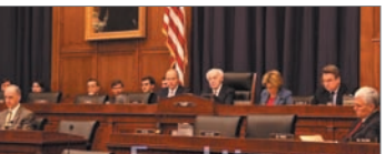
美众议院外交事务委员会举行听证会

在商业层次上，“金盾工程”带来巨额商机，吸引跨国高科技公司投入。2004年，中共警察利用雅虎提供的信息，以“泄露国家机密罪”判处中国记者涛十年徒刑。2007年