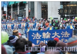
天国乐团参加加拿大圣诞节游行

法轮大法（法轮功）重视心性修炼，学炼者以“真、善、忍”作为修炼原则，洪传80多个国家与地区，法轮功书籍《转法轮》也被翻译成近30种语言，广受全世界的欢迎。