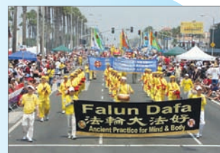
法轮大法广受美国民众欢迎