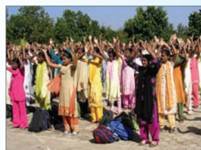
众多印度学生学炼法轮功