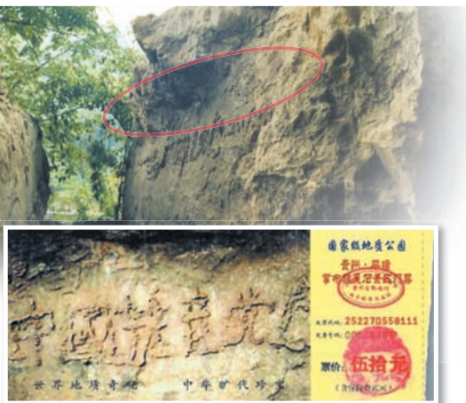
掌布风景区门票上藏字石

2002年6月贵州省平塘县掌布风景区发现2.7亿年的藏字石，五百年前崩裂的巨石断面内惊现“中国共产党亡”六个大字。经专家鉴定为天然成字，大陆媒体隐去“亡”字鼎力宣传，号称“救星石”。