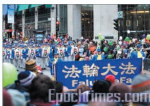
天国乐团参加加拿大圣诞游行

法轮大法（法轮功）重视心性修炼，学炼者以“真、善、忍”作为修炼原则，洪传80多个国家与地区，法轮功书籍《转法轮》也被翻译成近30种语言，广受全世界的欢迎。