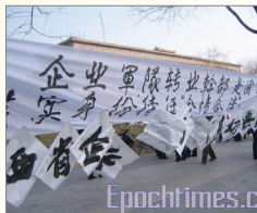
陕西二千军转干部要权益