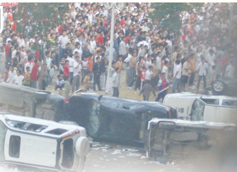
08年6月28日贵州瓮安少女被奸杀，上万民众抗议。