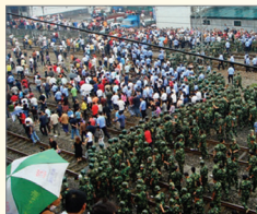
湖南吉首逾十万人抗议