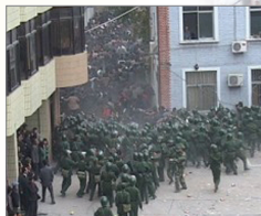
甘肃陇南五万人遭镇压