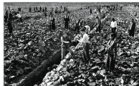
大跃进导致大饥荒

中共建政后死亡最多的政治运动是“大跃进”后的大饥荒，海内外学者对饿死人数的估计在3千万到4千5百万之间。这一场大饥荒被中共歪曲成“三年自然灾害”，实际上那三年风调雨顺，完全是彻底的“人祸”。