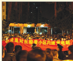
广州两千业主街头抗议