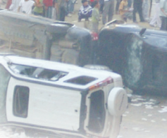
08年6月28日貴州甯安少女被姦殺，上萬民眾抗議。