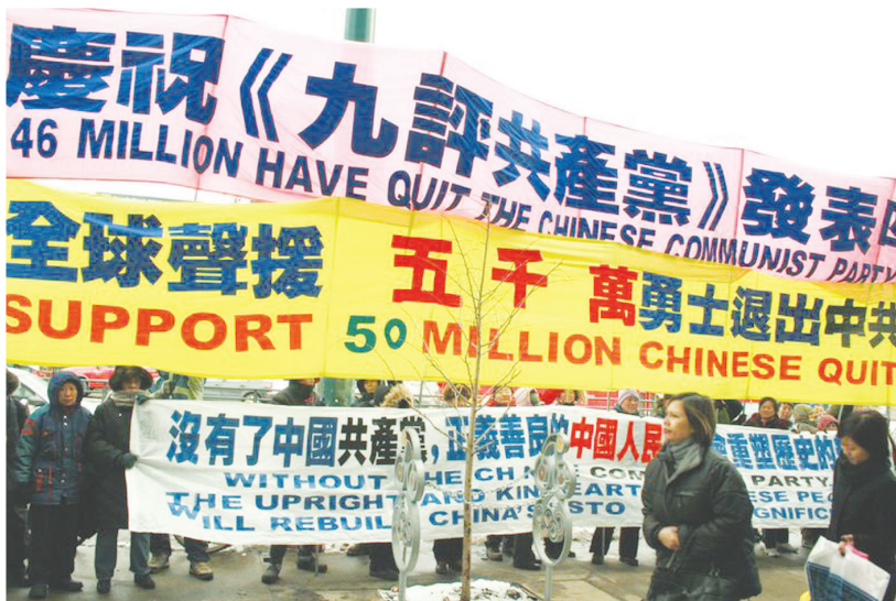
(左圖)加拿大多倫多舉行聲援五千萬三退集會，(右圖)香港聲援五千萬勇士三退遊行