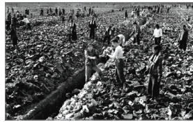
大躍進導致大飢荒

中共建政後死亡最多的政治運動是「大躍進」後的大饑荒，海內外學者對餓死人數的估計在3千萬到4千5百萬之間。這一場大饑荒被中共歪曲成「三年自然災害」，實際上那三年風調雨順，完全是徹底的「人禍」。