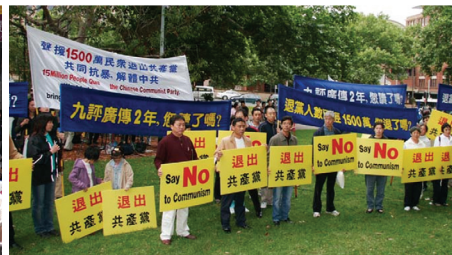
2006年11月5日悉尼聲援1500萬人三退集會