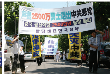
2007年8月19日韓國慶祝2500萬人三退