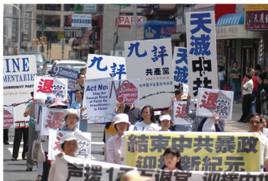
2006年5月6日費城聲援千萬人三退