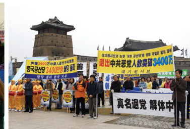
2008年3月30日韓國聲援3400萬人三退