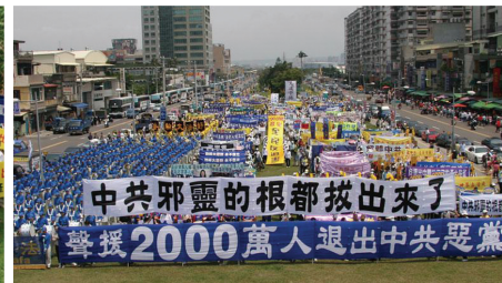
2007年4月15日台灣聲援2000萬人三退集會