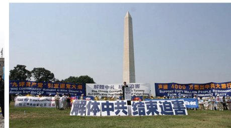
2008年7月18日華府舉行三退集會