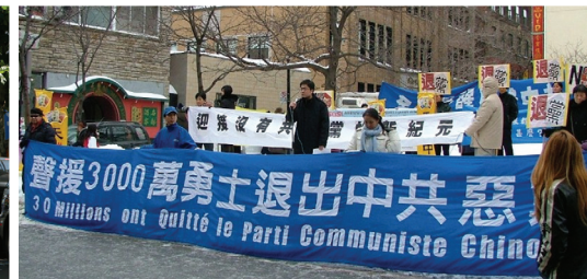
2008年1月5日蒙特利爾唐人街聲援3000萬人退出中共