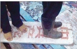
民众将中共牌匾踩在脚下

在中共政权高压的反超生计划政策下，2007年5月初开始，广西玉林市博白县五万民众反抗中共暴力计生，事件更蔓延到附近10个乡镇，近万名乡民火烧镇政府大楼、推倒围墙、烧公务车、追打计划生育政策执行官员、并且砸烂共产党的招牌。一民众表示：“大家对共产党印象非常非常不好，影响大家对它很不满，做到这种地步呢！群众的反应是这个政府太残暴了！没有人性！现在老百姓反反对共产党非常不满！”