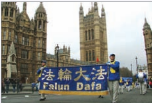
天国乐团参加英国伦敦新年游行