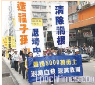
香港声援五千万勇士三退游行