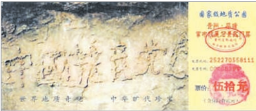
掌布风景区门票印上藏字石

2002年6月贵州省平塘县掌布风景区发现2.7亿年的藏字石，五百年前崩裂的巨石断面内惊现“中国共产党