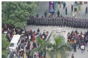
广州市天河区民众抗议现场