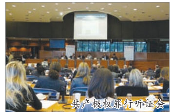
共产极权罪行听证会

此次听证会提议建立欧洲纪念和良知平台，强化现存对此项目的财政支持机制，并呼吁将8月23日定为纳粹和共产极权受害人纪念日。