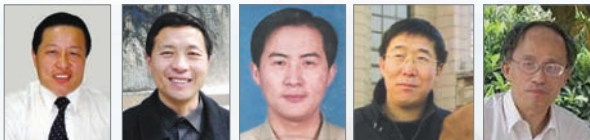
正义律师高智晟、唐吉田、李和平及民主人士徐永海、李国涛