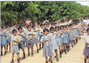
众多印度学生学炼法轮功