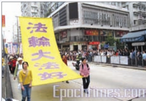
法轮大法在香港可自由修炼

法轮大法(法轮功)重视心性修炼，学炼者以“真、善、忍”作为修炼原则，洪传80多个国家与地区，法轮功书籍《转法轮》也被翻译成近30种语言，广受全世界的欢迎。