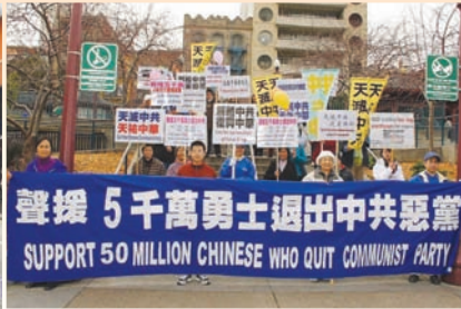
旧金山声援退党集会

《九评共产党》系列社论，从历史、政治、经济、文化、信仰等层面深刻揭示中共的欺骗、暴力、邪教和流氓本性，越来越多中国民众因此认清中共的本质、摆脱对中共的恐惧，主动退出中共，直到2009年2月，三退人数突破五千万。