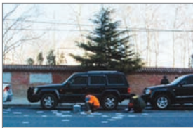
访民在大使馆前撒三千传单

2009年访民不再像以前持续不断地到各信访口上访，访民们选择了更为直接、更能引起各界关注的方式来诉冤，撒传单、打横幅、砸警车、自焚等等。