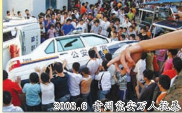
2008.6 贵州瓮安万人抗暴