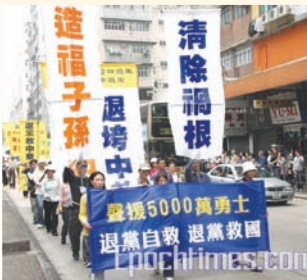
香港聲援五千萬勇士三退遊行