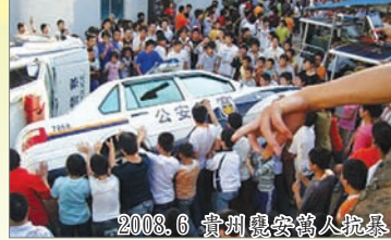
2008.6 貴州惠安萬人抗暴