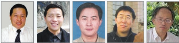
正義律師高智晟、唐吉田、李和平及民主人士徐永海、李國濤