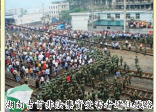
湖南吉首非法集會受審者堵住鐵路