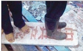
民眾將中共牌匾踩在腳下

在中共政權高壓的反超生計劃政策下，2007年5月初開始，廣西玉林市博白縣五萬民眾反抗中共暴力計生，事件更蔓延到附近10個鄉鎮，近萬名鄉民火燒鎮政府大樓、推倒圍牆、燒公務車、追打計劃生育政策執行官員、並且砸爛共產黨的招牌。一民眾表示：「大家對共產黨印象非常非常不好，影響大家對它很不滿，做到這種地步呢！群眾的反應是這個政府太殘暴了！沒有人性！現在老百姓反正對共產黨非常不滿！」