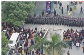
廣州市天河區民眾抗議現場