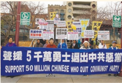
舊金山聲援退黨集會

《九評共產黨》系列社論，從歷史、政治、經濟、文化、信仰等層面深刻揭示中共的欺騙、暴力、邪教和流氓本性，越來越多中國民眾因此認清中共的本質、擺脫對中共的恐懼，主動退出中共，直到2009年2月，三退人數突破五千萬。