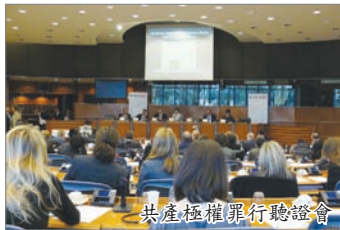
共產極權罪行聽證會

此次聽證會提議建立歐洲紀念和良知平台，強化現存對此項目的財政支持機制，並呼籲將8月23日定為納粹和共產極權受害人紀念日。