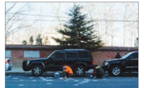
访民在大使馆前撒三千传单

2009年访民不再像以前持续不断地到各信访口上访，访民们选择了更为直接、更能引起各界关注的方式来诉冤，撒传单、打横幅、砸警车、自焚等等。