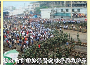
湖南吉首非法集资受害群众维权