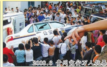
2008.6 贵州瓮安万人抗暴