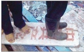
民众将中共牌匾踩在脚下

在中共政权高压的反超生计划政策下，2007年5月初开始，广西玉林市博白县五万民众反抗中共暴力计生，事件更蔓延到附近10个乡镇，近万名乡民火烧镇政府大楼、推倒围墙、烧公务车、追打计划生育政策执行官员、并且砸烂共产党的招牌。一民众表示：“大家对共产党印象非常不好，影响大家对它很不满，做到这种地步呢！群众的反应是这个政府太残暴了！没有人性！现在老百姓反正对共产党非常不满！”