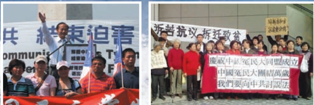
中国民主党世界同盟会主席王 36位上海访民在香港庆祝中国冤民大 军带领60位成员退出中共。 同盟成立，十多人真名退出中共

在中国历史上，苍天刻文于石向世人预警不是头一回。秦朝便有“亡秦者胡”的石碑出现，秦始皇以为“胡”指匈奴，筑万里长城保卫秦土，并派大将蒙恬北伐。但秦帝国还是亡于秦二世“胡”亥之手。元朝至正年间，民间流传童谣说“石人一只眼，挑动黄河天下反”，后丞相脱脱治理黄河，掘出刻着童谣的独眼石人，接着各地农民起义，元朝灭亡。奇石出世间必有大事。