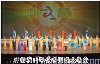
神韵演出深受各国观众喜爱

神韵晚会，广受各国民众喜爱，加拿大心理学家Gary Bell表示晚会让我从不同方面领略