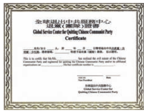
全球退党服务中心“三退证书”

全球退党服务中心纽约总部新增服务项目：为声明三退的民众办理具有法律效用的《三退证书》。据美国移民局反馈，他们非常高兴能有这样的证