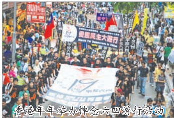
香港年年举办悼念六四游行活动

1989年6月4日中共在天安门以军队镇压请愿的北京市民及学生，震惊国际。随着六四20周年逼近，民运人士及香港民间团体将发表六四悼念活动，而中共已开始加强天安门广场警备及封杀六四相关言论。