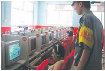
中国网民上网受限制

美国人权团体“自由之家”最近发布网际网路自由状况的报告，指出中国被列为控制网路自由最严厉的国家之一。据美国之音报导，自由之家于5月2日发表2009年对全球195个国家所评估的新闻自由年度报告认为，中国仍是对新闻自由钳制最严重的国家。