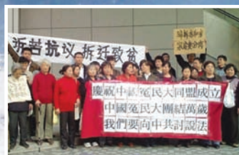
36位上海访民在香港庆祝中国冤民大同盟成立，十多人真名退出中共

年7月18日中国民主党世界同盟会主席王军在声援退党集会上带领60位成员当场退出中共。2008年11月维权律师郑恩宠真名三退，民众起而仿效，陕西一次维权活动中就有50人真名退党。2008年12月9日，约36位上海访民，在香港警察总部庆祝中国冤民大同盟成立。十多人同时宣布真名退出中共相关组织。