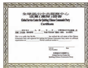
全球退党服务中心“三退证书”

全球退党服务中心纽约总部新增服务项目：为声明三退的民众办理具有法律效用的《三退证书》。据美国移民局反馈，他们非常高兴能有这样的证