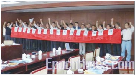
5月17日，数十名中国律师在北京研讨会上集体手举横幅谴责重庆公安酷刑拷打执业律师。