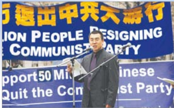
前中国国安官员李凤智公开退党

自2004年11月，三退（退出中国共产党、团、队）活动开展以来，声明退出中共人数即将突破5500万。