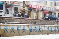
中国北方出现天灭中共