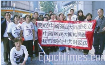
中国冤民大同盟成员纷纷三退