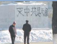
东北出现天灭中共