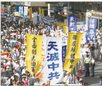
2009年香港民众七一大游行现场

香港前政务司长陈方安生及前民主党主席李柱铭亦有参与这次游行，同时首次有公务员团体参加游行，包括康乐文化事务署工会，亦有多名公务员工会成员，以个人身份游行。陈方安生批评政府拖延双普选，要求尽快落实。