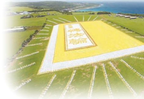
台湾六千名法轮功学员排《转法轮》一书

法轮功也称法轮大法，自1992年开始在中国社会公开传授，如今已洪传114个国家与地区，法轮功最重要书籍《转法轮》被翻译成30多种语言在世界各地发行，海外各国政府与政要颁发给法轮功的褒奖与支持议案已超过1500多项。自2000年起，法轮功创始人李洪志先生并连续四年获得诺贝尔和平奖提名。