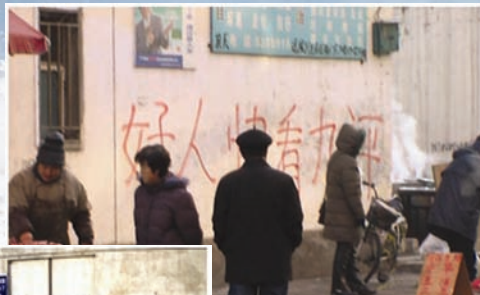
中国各地流传三退标语