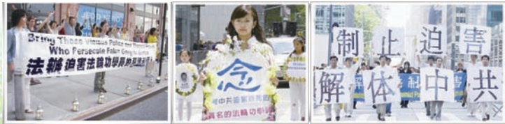
全球各地法轮功学员呼吁制止迫害

2008年，由“法轮功受迫害真相联合调查团”发起的全球“百万签名”反迫害活动，半年内共取得逾135万名来自全球各