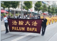
法轮功在北欧的游行队伍