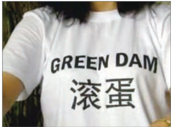
中国民众身穿“绿坝滚蛋”上衣

7月1日，本是中共当局强迫中国全国所有销售的个人电脑预装绿坝过滤软件截止的日子；但是6月30日，北京工信部在新华网上发布消息说要暂缓实施这项规定。“全球互联