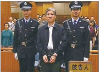
2007年 中共贪官郑筱萸遭枪毙

据中国《改革杂志》报导说，今年上半年以来中国有近百名官员因为贪腐而下台，其中包括不少省部级高官。其中有公安部部长助理郑少东，长春市委书记米凤君，广东省政协主席陈绍基，浙江省纪委书记王华元，深圳市长许宗衡等一批高级官员，另有数十名腐败官员被判处重刑。