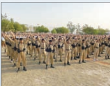
印度警校学生炼法轮功