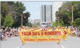
法轮功参加加拿大游行