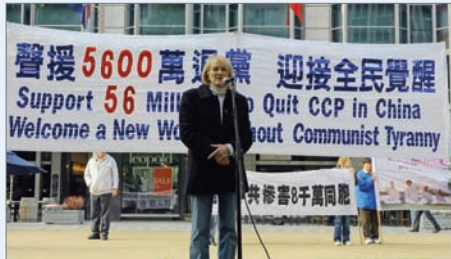
澳洲墨尔本集会声援三退