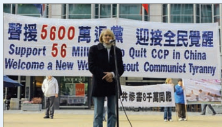
澳洲墨尔本集会声援退党