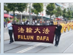
法轮功在北欧的游行队伍