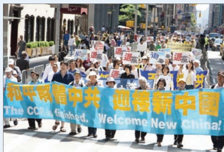
纽约曼哈顿六千人大游行