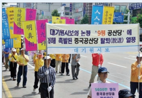
韩国首尔声援五千六百万人三退