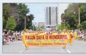
法轮功参加加拿大游行