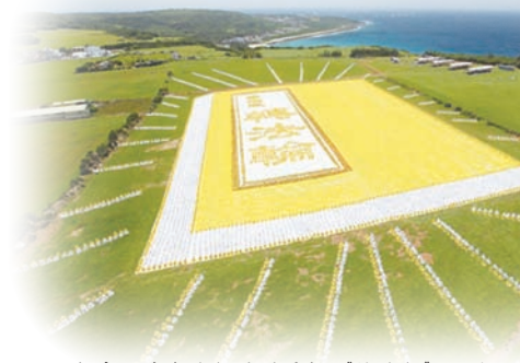
台湾六千名法轮功学员排《转法轮》一书

法轮功也称法轮大法，自1992年开始在中国社会公开传授，如今已洪传114个国家与地区，法轮功最重要书籍《转法轮》被翻译成30多种语言在世界各地发行，海外各国政府与政要颁发给法轮功的褒奖与支持议案已超过1500多项。自2000年起，法轮功创始人李洪志先生并连续四年获得诺贝尔和平奖提名。