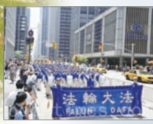
法轮功在曼哈顿大游行

法轮功也称法轮大法，自1992年开始在中国社会公开传授，如今已洪传114个国家与地区，法轮功最重要书籍《转法轮》被翻译成30多种语言在世界各地发行，海外各国政府与政要颁发给法轮功的褒奖与支持议案已超过1500多项。自2000年起，法轮功创始人李洪志先生并连续四年获得诺贝尔和平奖提名。