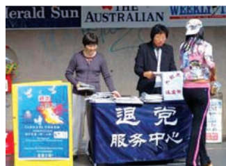
澳洲墨尔本退党点