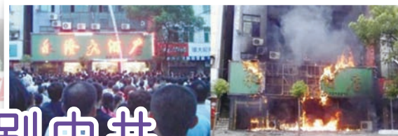
石首7万人抗暴事件

据中国公安部门的统计，中国大陆群体性事件从1993年的8,700件，到1999年超过3万2,000件，到2006年的59万9,392件，呈现爆炸性成长。