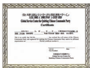
全球退党服务中心“三退证书”

全球退党服务中心纽约总部新增服务项目：为声明三退的民众办理具有法律效用的《三退证书》。据美国移民局反馈，他们非常高兴能有这样的证书，解决辨识申请人身分真伪(证明不是共产党员)的困难。《九评》还被作为审批身份时的参考书。《三退证书》由全球退党服务中心总部统一制备和签署，可直接向纽约退党服务中心总部查询，也可通过当地退党服务中心义工办理。