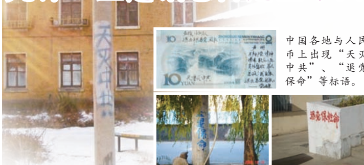
中国各地与人民币上出现“天灭中共”、“退党保命”等标语。

目前中国民众兴起以传单、纸币、标语等方式传播《九评》、三退相关讯息；争当传《九评》、促三退的福音天使遍布城市农村，显示三退大潮势不可挡。每天海外退党服务中心都能接到成千上万的人打来的咨询电话，最多时一天要接几十万打进来的电话，都是为了要索要《九评共产党》和了解三退的情况，其中包括许多从最初害怕到联合起来维权的民众。