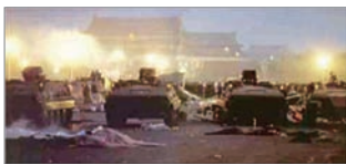
六四天安門屠殺學生

1989年6月3日晚到4日清晨，中共軍隊出動坦克武力鎮壓數萬要求民主改革而絕食的學生及北京民眾，造成至少數百人、甚至上千人喪生，其中多半是學生。1989年12月，中共國防部長遲浩田訪問華府，在美國防大學演說時，面對听眾關於「六四事件」的提問，遲浩田竟當眾表示：「天安門廣場上沒死一個人」。