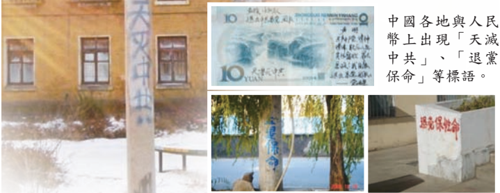
中國各地與人民幣上出現「天滅中共」、「退黨保命」等標語。

目前中國民眾興起以傳單、紙幣、標語等方式傳播《九評》、三退相關訊息；爭當傳《九評》、促三退的福音天使遍佈城市農村，顯示三退大潮勢不可擋。每天海外退黨服務中心都能接到成千上萬的人打來的諮詢電話，最多時一天要接幾十萬人打進來的電話，都是為了要索要《九評共產黨》和了解三退的情況，其中包括許多從最初害怕到聯合起來維權的民眾。