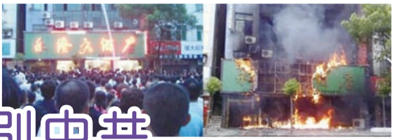
石首7萬人抗暴事件

據中國公安部門的統計，中國大陸群體性事件從1993年的8,700件，到1999年超過3萬2,000件，到2006年的59萬9,392件，呈現爆炸性成長。