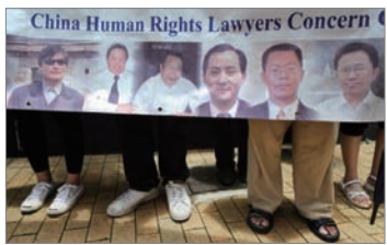
人权团体要求释放人权律师

针对中国不断涌现的多起律师为弱势群体维权案，尤其是律师为法轮功学员所作的无罪辩护案件，中共司法部部长吴爱英要求律师代理敏感案件必须讲政治、顾大局、守纪律。