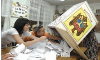
摩尔多瓦选举工作人员在统计选票

近日黑龙江也传出有鼠疫蔓延，8月10日黑龙江省伊春市金山屯区白山林场爆发5例鼠疫；11日金山屯区丰茂林场爆发3例鼠疫，金山屯区1例。院方否认患者感染鼠疫，而是由老鼠传播的流行性出血热病例。