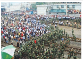
湖南吉首非法集资受害者堵住铁路