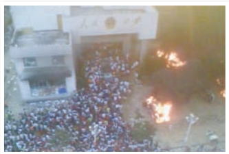
贵州瓮安万人抗暴

2008年9月23日到25日，湖南吉首县官商勾结200亿非法集资案引发数万受害群众连续3天围堵州政府门口请愿，遭到警察武力驱赶，因此激起更大民愤，州政府牌子被人取下。