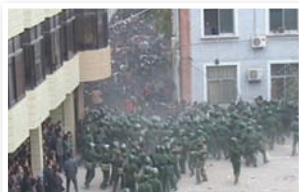
甘肃陇南五万人抗暴遭镇压