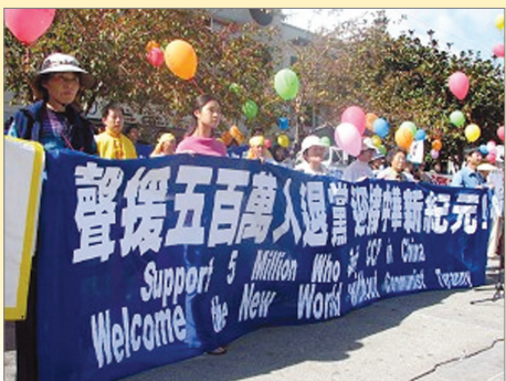
美国旧金山支持五百万华人退出中共