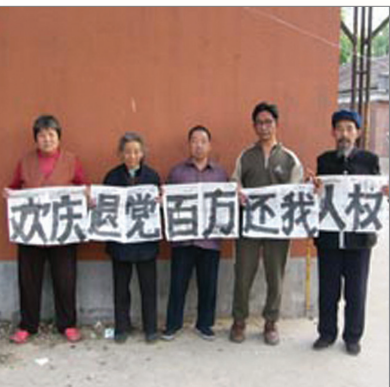
中国大陆民众欢庆百万人退党