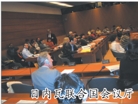
国内瓦联合国会议厅