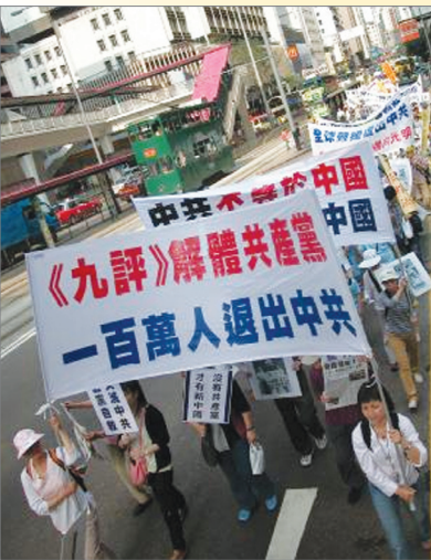
香港支持一百万华人退出中共