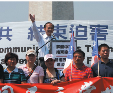
中国民主党世界同盟会主席王军在华府带领60位成员退出中共。