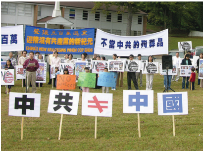
美国亚特兰大声援退出中共集会