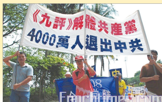
马来西亚支持四千万华人退出中共