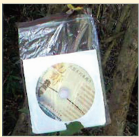
河北某地树上的《九评》光盘