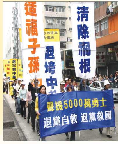
香港支持五千万华人退出中共