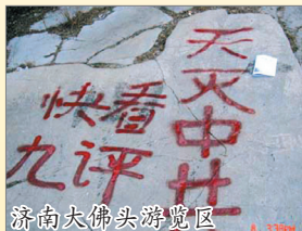
济南大佛头游览区