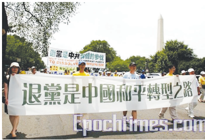
美国华盛顿支持中国民众退出中共