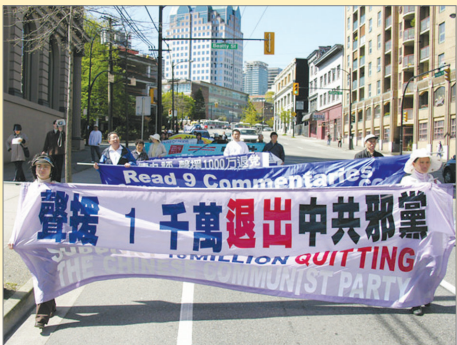
加拿大温哥华支持一千万华人退出中共