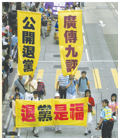
香港声援退党的集会游行