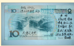
人民币上流传退党声明