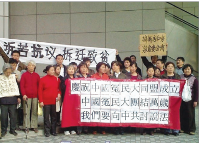
36位上海访民在香港庆祝中国宽民大同盟成立。十多人真名退出中共。