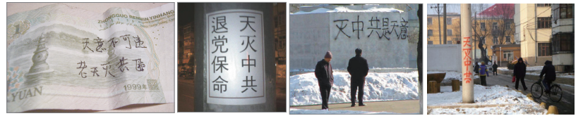
中国各地与人民币上出现的三退标语

“天灭中共”、“退党保命”、“退党得福报”等三退标语在中国各地与人民币上频繁出现，据大陆民众反馈，尽管中共打压，但是“三退”人民币的传播并没有受到影响，反而越传越广。还有更多的大陆民众将“三退”声明写在布告栏、车站牌、电线杆广告栏等公共场所。