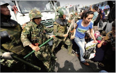
2009.7.5 中共镇压维族民众

二零零九年七月五日，乌鲁木齐发生维汉仇杀；二零零八年三月十四日中共镇压西藏僧侣，冲突中藏族、维族、汉族和中共军队三方都使用了暴力，中共归罪于海外流亡组织的操控，但事件的真正导火索是积累了几十年的民族仇恨，其实双方民众都是受害者，而凶手是背后煽动仇恨的中共。