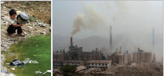
中国因环境污染 经济损失每年一千亿美元

二零零六年世界卫生组织报告显示，全球污染最严重的二十个城市里中国占了十六个。二零零七年世界银行指出，中国每年因空气污染的死亡人数达三十五点八万，因水污染死亡六万人，环境损失达到每年一千亿美元，相对于中国GDP的5.8％。目前中国90％的河流被污染，四亿农村人没有清洁的饮用水，近90％的城市人呼吸的空气受污染。土地贫瘠、污染严重已使农业陷入困境，而随处可见的“癌症村”、“怪病乡”，更是把民众置于水生深热之中。