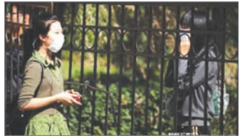
H1N1流感在多所学校蔓延

注射H1N1甲流疫苗，北京东直门中学400多人注射疫苗后，陆续有学生出现头晕、发热等反应。世卫总干事陈冯富珍拒绝回应有关中国疫苗的安全性及有效性，指问题应该由生产疫苗的公司回答。