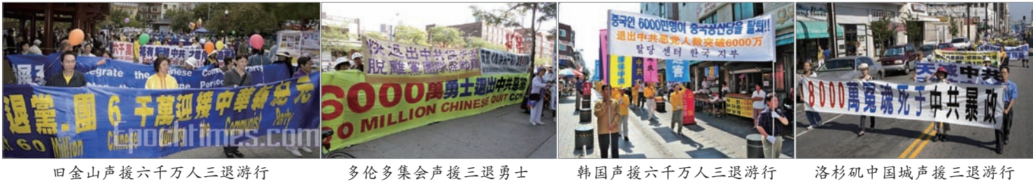
旧金山声援六千万人三退游行