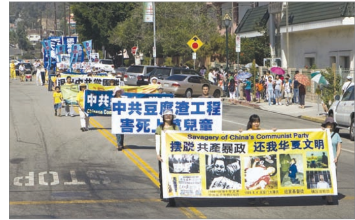
美国洛杉矶多个团体在中国城举行集会游行，庆祝超过6千万人三退

2004年11月19日大纪元发表《九评共产党》系列社论，揭穿中共的邪恶本质，觉醒的大陆和海外民众纷纷选择退出中共的一切组织。