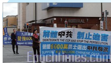
9月26日，爱尔兰举行声援退党游行