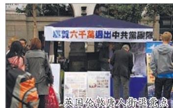
英国伦敦唐人街退党点