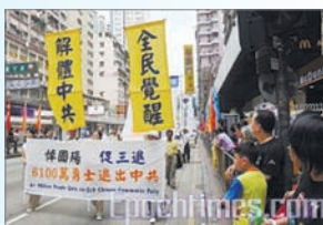
10月3日香港举办退出中共游行