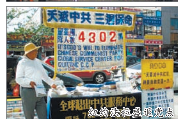
纽约法拉盛退党点