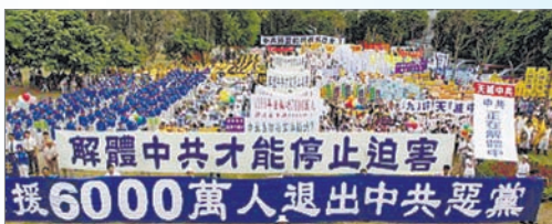
9月27日台湾声援6100万勇士退出中共游行