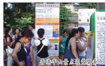
香港半山景点退党服务点

“全球退党服务中心”更于2005年2月在美国正式注册，为享有免税政策的非盈利组织。据海外三退义工说，中国的游客对“三退”的反映，从刚开始的不理解，到现在争先恐后的退、甚至用真名退，从这走势看，大陆民众赴海外旅游退党已经成为热潮。