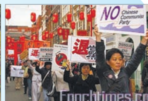
10月3日英国声援6100万退党