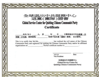
全球退党服务中心“三退证书”

全球退党服务中心纽约总部新增服务项目：为声明三退的民众办理具有法律效用的《三退证书》。据美国移民局反馈，他们非常高兴能有这样的证书，解决辨识申请人身分真伪(证明不是共产党员)的困难。《九评》还被作为审批身份时的参考书。《三退证书》由全球退党服务中心总部统一制备和签署，可直接向纽约退党服务中心总部查询，也可通过当地退党服务中心义工办理。