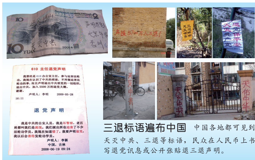
三退标语遍布中国 中国各地都可见到天灭中共、三退等标语，民众在人民币上书写退党讯息或公开张贴退三退声明。