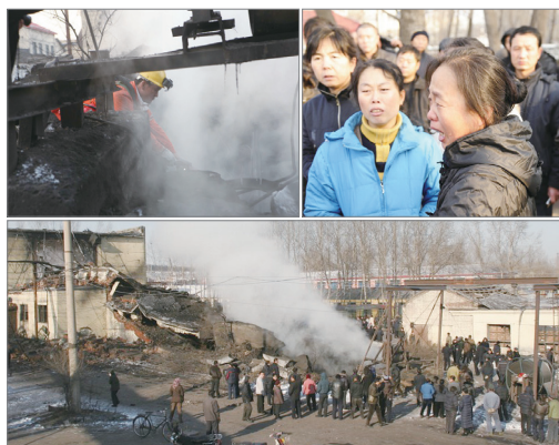
11月21日黑龙江新兴煤矿矿难造成104人死亡

中国矿业恶劣的安全记录令人忧心，近三年来，遇难人数高达1,698人。统计显示，这几年中国煤矿事故死亡人数是世界其他主要采煤国家死亡总人数的4倍，中国百万吨煤死亡率是美国的100倍、印度的10倍。