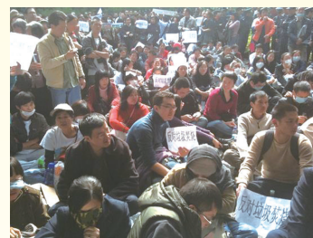
广州民众抗议建焚烧炉静坐现场

11月23日广州两千名番禺区市民自发聚集到市政府，抗议广州当局继续“垃圾焚烧发电厂”项目。事件得到中国网络关注，但在媒体上遭到封杀。据抗议民众透露，已建成运转的李坑焚烧厂，已给附近居民身体造成巨大伤害、环境遭污染，政府却无视这一切。