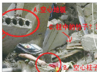
2008年川震中害死学生的豆腐渣工程

说明中国对信息的控制。美国国会众议院则通过决议，呼吁中国政府释放黄琦和同样因帮助川震受难者调查死因遭到审讯的四川作家谭作人。